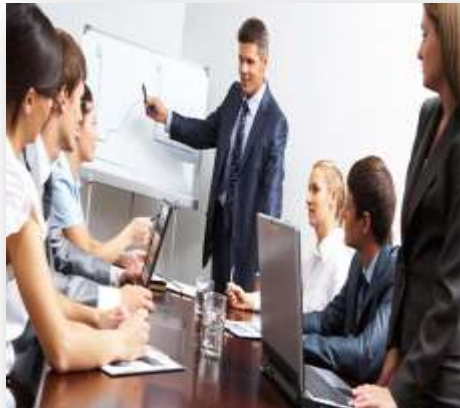
Στέλεχος ναυτιλιακών επιχειρήσεων