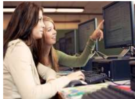
Υπεύθυνος οργάνωσης δραστηριοτήτων στις διάφορες μορφές τουρισμού