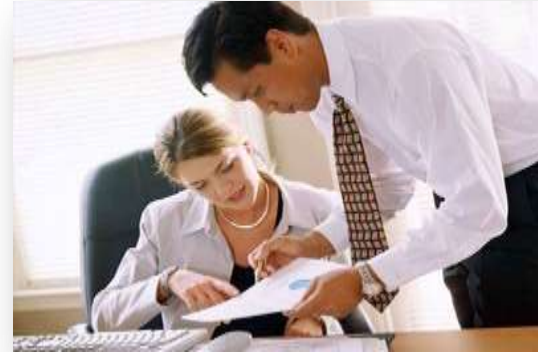
Σύμβουλος ενεργειακών επενδύσεων