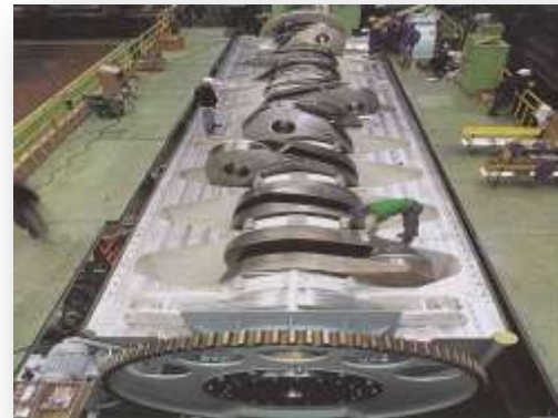
Σχεδιαστής μηχανών πλοίων.