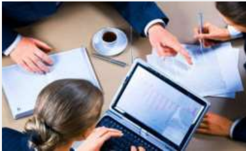
Στέλεχος διαδικτυακού τουριστικού marketing.