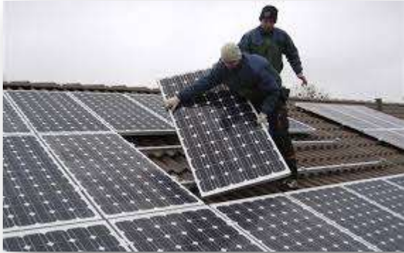
Τεχνικός αυτοματισμών και φωτοβολταϊκών συστημάτων