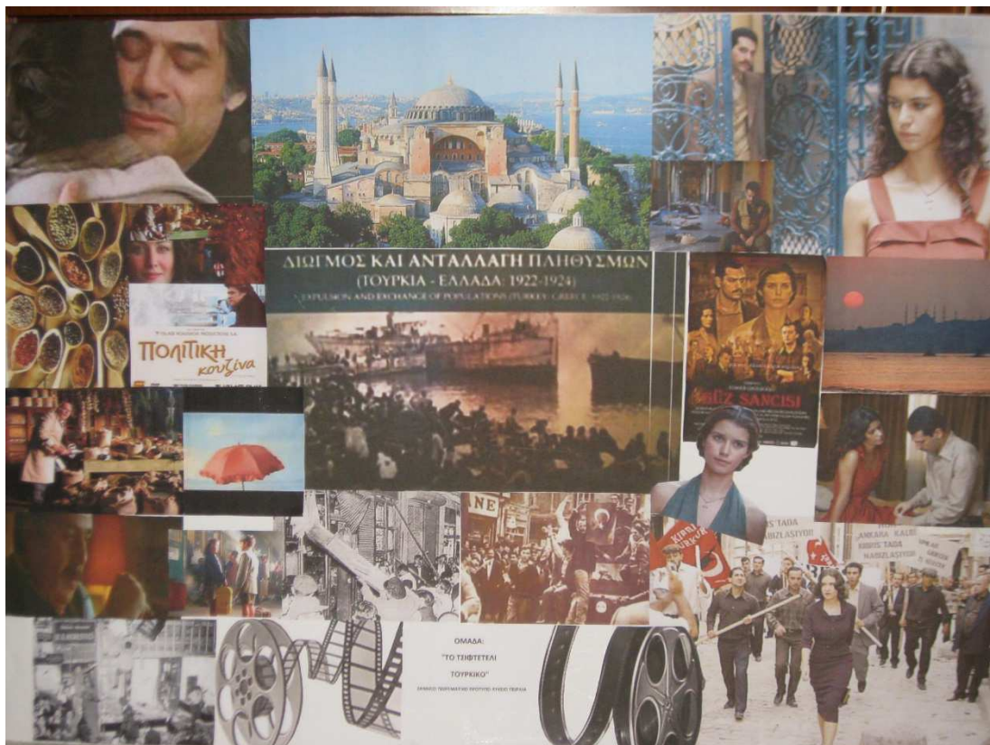
Το κολάζ από την ομάδα «Τσιφτετέλι τούρκικο» που εκθέσαμε και στο 1 ο Φεστιβάλ των Ερευνητικών Εργασιών, στο οποίο συμμετείχαμε.